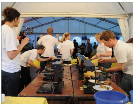
Pour les 30 ans de Make-A-Wish, MCI a offert une demi-journée à ses employés afin d'œuvrer tous ensemble pour une même cause.

L'objectif de Philiass vis-à-vis de ses membres est de continuer à faciliter leurs initiatives en leur proposant une vie de réseau active ainsi qu'un soutien sur mesure pour ceux qui souhaitent être accompagnés dans la définition et la mise en œuvre de leur démarche RSE.