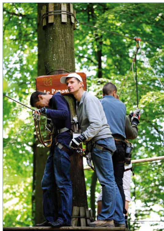
Dépassement de soi: parcours d'accrobranche entre des volontaires HSBC et des jeunes du SEMO de la Croix-Rouge (Genève)